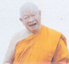
สมเด็จพระญาณวชิโรดม (วิองค์ สิริบุโร)