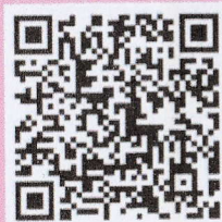
ลงทะเบียนสมัครเรียน