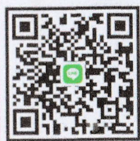
สมัครผ่านไลน์กลุ่ม