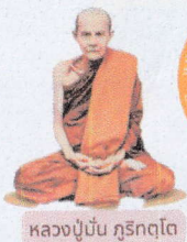
หลวงปู่ปั้น ภูริกตฺโต